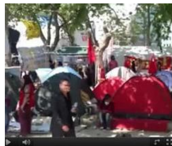
Istanbul, è stato occupato Gezi Park...